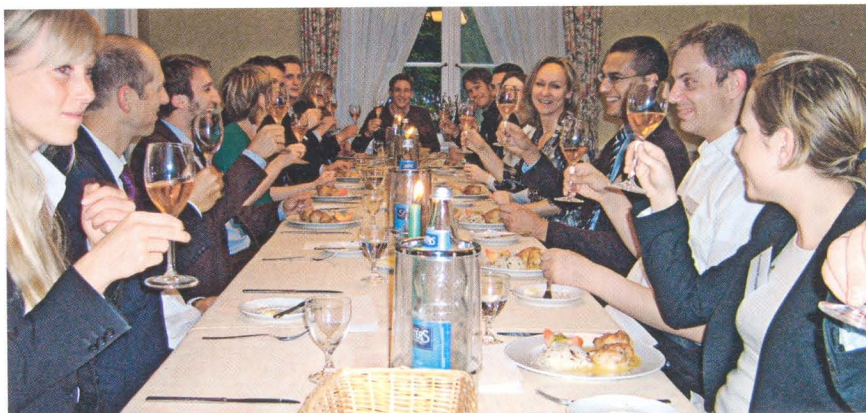
Zum Wohl | Weingläser werden am Stiel gehalten, um die Temperatur des Getränks nicht zu verändern.